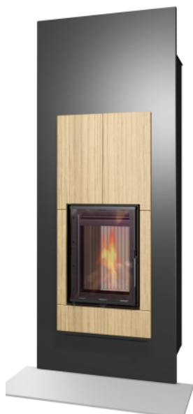
MALAGA W 02