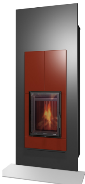
MALAGA W 03